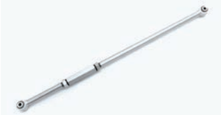
BATTLEZ ラテラルロッド ¥38,500(税込)