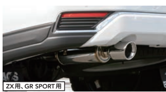
ZX 用、GR SPORT 用 BATTLEZ マフラー ZS 【ディーゼル車用】¥74,800(税込)

■各商品は適用車種であっても、グレード・ボディ形状等によって設定が異なる場合があります。ご購入の際はよくご確認ください。■掲載されている商品は撮影用の為、実際の商品とは細部において異なる場合があります。■商品の仕様及び価格は予告なく変更する場合があります。■商品のご購入及び詳細については、もよりの有名自動車用品販売店または、4WDショップまでお問い合わせください。