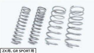
ZX 用、GR SPORT 用 BATTLEZ リフトアップスプリング Ti-W 【エンジン別設定】¥81,400(税込)