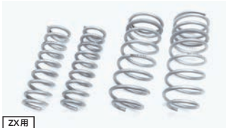
ZX 用 BATTLEZ ローダウンスプリング Ti-W 【エンジン別設定】¥75,900(税込)