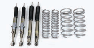
ZX, GR SPORT, VX, AX 用 BATTLEZ リフトアップセット VFCA 【エンジン別設定】¥209,000(税込)