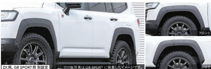
ZX用, GR SPORT用 別設定