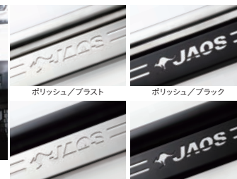
ポリッシュ/プラスト