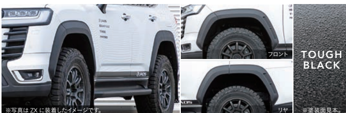
※写真はZXに装着したイメージです。