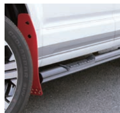
JAOS サイドステップ ブラック ¥96,800(税込)