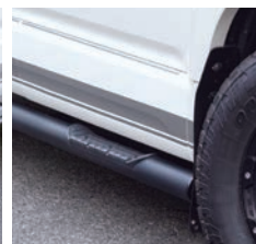
JAOS サイドステップ ブラック 右側(運転席側) ¥48,400(税込)