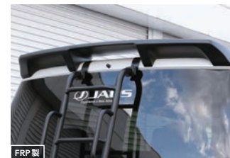
FRP製 JAOS ルーフスポイラー type-B 【マットブラック】¥72,600(税込) 【未塗装品】¥52,800(税込)