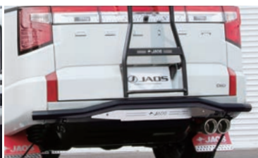
JAOS リヤスキッドバー 各 ¥74,800(税込)