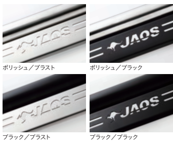
JAOS フロントスキッドバー 各 ¥74,800(税込)