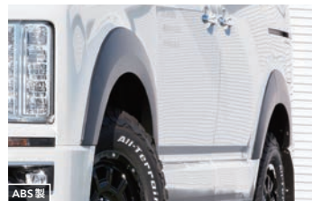
ABS製 JAOS フェンダーガーニッシュ type-S 【マットブラック】¥81,400(税込) 【未塗装品】¥59,400(税込)