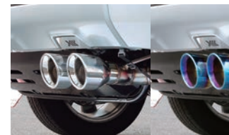
BATTLEZ マフラー ZS-2/ZS-2 TC 【ZS-2】¥70,400(税込) 【ZS-2 チタンカラーテール】¥81,400(税込)