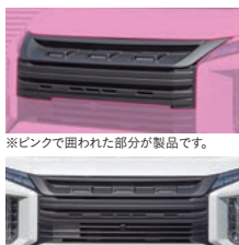
※ピンクで囲われた部分が製品です。 ※写真は マットブラックです。