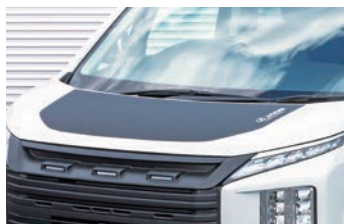
※写真はカーボン調(AES)です。 JAOS ホットプロテクター 【カーボン調、マットブラック】¥66,000(税込) 【未塗装品】¥57,200(税込)