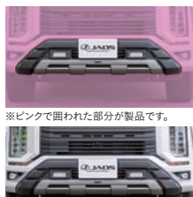
※ピンクで囲われた部分が製品です。 ※写真は マットブラックです。