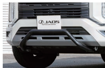
JAOS フロントプッシュバー ¥74,800(税込)