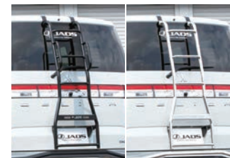
JAOS リヤラダーII (ポリッシュ or ブラック) 【ハンドル付】¥68,200(税込) 【ハンドル無】¥61,600(税込)