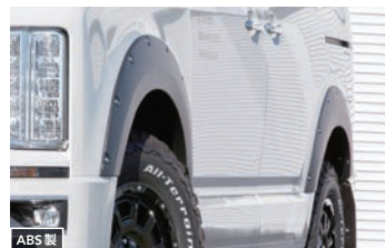
ABS製 JAOS フェンダーガーニッシュ type-X 【マットブラック】¥85,800(税込) 【未塗装品】¥63,800(税込)

用途に合わせたアレンジや自分好みのスタイルへ拡張する JAOS フラットラック オプション 好評発売中!! ■詳しくはJAOS公式サイトをご覧ください。