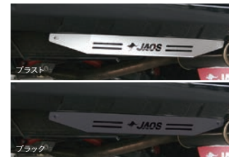
JAOS リヤスキッドプレート (プラスト、ブラック) 各 ¥15,400(税込)