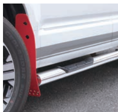
JAOS サイドステップ ポリッシュ ¥118,800(税込)