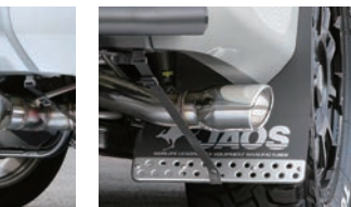
BATTLEZ マフラー ZS-5 ¥52,800(税込)