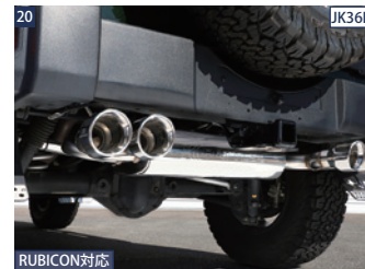
BATTLEZマフラー-ZS-4サークル ■フルステンレス ■1ピース ■メイン：60.5φ テール：サークル(101φ)×4本 ■大型シングルサイレンサー ■平成22年騒音規制適合