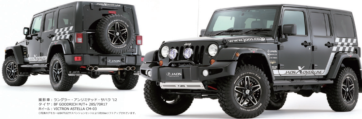
撮影車：ラングラー・アンリミテッド・サハラ'12 タイヤ：BF GOODRICH M/T+ 285/70R17 ホイール：VICTRON ASTELLA CM-03 ©写真のデモカーはBATTLEZサスペンションセットにより約50mmリフトアップされています。