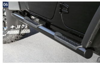
JAOSブラックサイドステップ ■チューブ・スチール76.2φ/カチオン電着塗装+ブラック粉体塗装 ■ステップ:インジェクション成形樹脂 ■純正交換 ■地上高：420mm(純正車高/ハイブ下面)