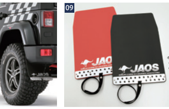
JAOSマッドガード車種別取付キット ■車種別取付ブラケット+型紙/1台分 ■1台分の装着にはJAOSマッドガード汎用タイプM(税込¥13,000)が2セット必要