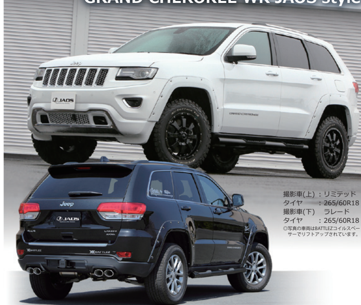
撮影車(上): リミテッド タイヤ: 265/60R18 撮影車(下): ラレード タイヤ: 265/60R18 ○写真の車両はBATTLEZコイルスパーサーでリフトアップされています。