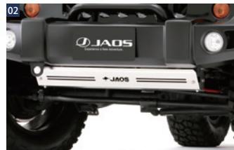
JAOSスキッドプレートSC ■ステンレス/電解研磨+ショットブラスト ■JAOSフロントスポーツカウル用