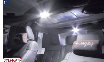
JAOS LEDルームランプ ■センター+リヤ ■LED総数24個(約1.9W) ■純正交換