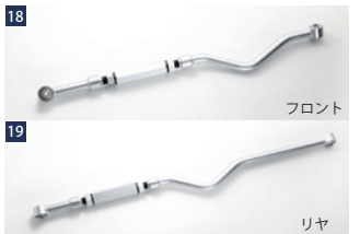
BATTLEZラテラルロッド ■ターンブル調整式 ■調整範囲:-10~40mm(対応車高±約100mm)