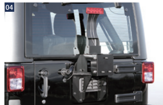
JAOSスベアタイヤブラケット/JAOSリヤバンパーカバー用 ■スチール/ブラック粉体塗装 ■純正交換 ■オフセット調整機能付(20mm) ■適応サイズ：ホイール…17x7.5Jインセット44~タイヤ外径…835mm(285/70R17) ■ラグナットは純正を使用