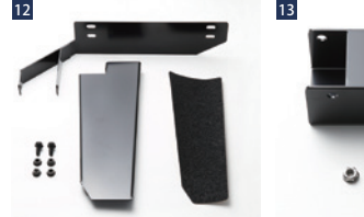
JAOSフットレスト ■スチール/カチオン電着/滑り止めシート付 ■ボルトオン ■左ハンドル車装着不可