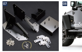
JAOSスベアタイヤブラケット/純正バンパー用 ■スチール/ブラック粉体塗装 ■純正交換 ■オフセット調整機能付(20mm) ■適応サイズ:ホイール…17x7.5Jインセット44~タイヤ外径…835mm(285/70R17) ■ラグナットは純正を使用