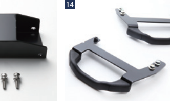
JAOSアクセルペダルスペーサー ■ステンレス/カチオン電着 ■ボルトオン ■左ハンドル車装着不可 ■2011年以降のサブワーカー装着車はJAOSアンプ移動ブラケットが別途必要