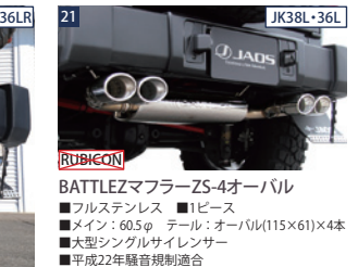
BATTLEZマフラー-ZS-4オーバル ■フルステンレス ■1ピース ■メイン：60.5φ テール：オーバル(115×61)×4本 ■大型シングルサイレンサー ■平成22年騒音規制適合