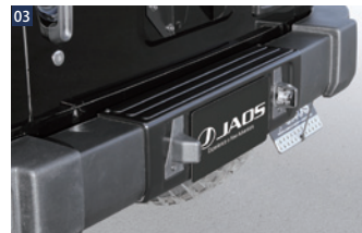
JAOSリヤバンパーカバー ■FRP/未塗装 ■タッピングネジ ■バンパーカット及び配線加工、ナンバープレートの再封印が必要 ■純正スベアタイヤブラケットのままでは、スベアタイヤが装着できません。