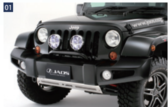
JAOSフロントスポーツカウル ■FRP(モノコック)未塗装 ■ボルトオン ■フログラフ純正流用

2015年夏、BATTLEZコイルシリーズ最大ともいえるリニューアルを行いました。その軸となるのは保証体制。「ヘタリ」を同製品が販売している限り交換保証するというものです。その名も「Ti-W(Warranty=保証)」。また、今回のリニューアルに伴って、コイルカラーを「BATTLEZレッド」から「BATTLEZシルバー」へと変更しています。保証内容の詳細については、JAOS オフィシャルサイトを参照ください。