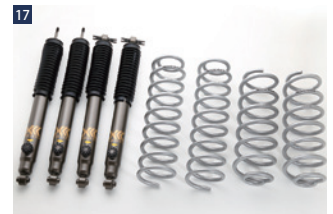
BATTLEZサスペンションセット ■セット内容:BATTLEZコイル Ti-W+BATTLEZダンパー VFA