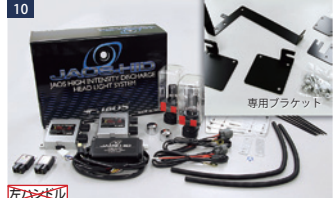
JAOS HIDヘッドライト車種別専用キット2 ■HID/バルブ：H4DUAL(H/Low切替)6000K(ライトブルーホワイト/PHILIPS製) ■HID/バラスト：インバーター・イグナイター(Panasonic製) ■専用ブラケット：ステンレス製/カチオン塗装