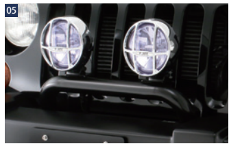
JAOSランプバーSC ■スチール/ブラック粉体塗装 ■フロントスポーツカウル装着車専用 ■ランプバー本体は外部突起規制不適合。また、ランプを装着した場合、装着位置により車検不適合