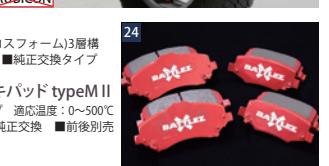
BATTLEZブレーキパッド typeM II ■純正交換 ■前後別売