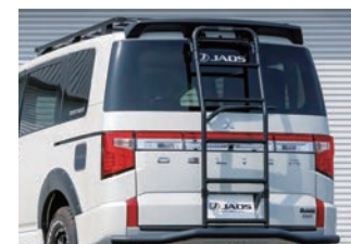
JAOS リヤラダー AL ¥85,800(税込)