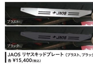
JAOS リヤスキッドプレート (プラスト、ブラック) 各 ¥15,400(税込)