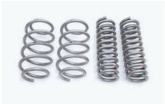
BATTLEZ リフトアップスプリング Ti-W 【ディーゼル 19+用】¥64,900(税込)

■年式：19.02- ■取付時間：3.0H ■取付方法：純正交換 ■リフトアップ：フロント 約20mm、リヤ 20～25mm