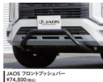
JAOS フロントプッシュバー ¥74,800(税込)