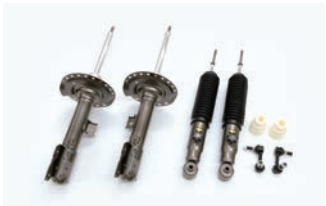
BATTLEZ ダンパー VFAS 【ディーゼル 19+用】¥104,500(税込)

■年式：19.02- ■取付時間：3.0H ■取付方法：純正交換 ■リフトアップ：フロント 約20mm、リヤ 20～25mm