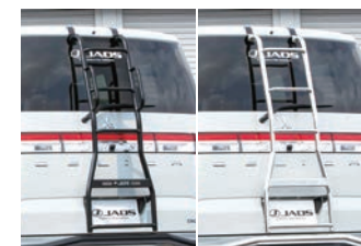
JAOS リヤラダーII (ポリッシュ or ブラック) 【ハンドル付】 ¥68,200(税込) 【ハンドル無】 ¥61,600(税込)