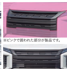
※ピンクで囲われた部分が製品です。 ※写真は マットブラックです。