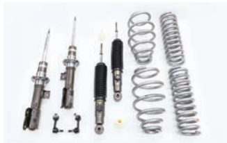
BATTLEZ リフトアップセット VFCA 【ディーゼル 19+用】¥182,600(税込)

■年式：19.02- ■取付時間：2.5H ■取付方法：純正交換 ■減衰力調整：フロント(固定式) リヤ(14段ダイヤル調整式)