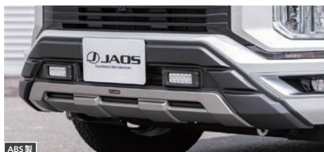
JAOS フロントバンパーガード 【マットブラック】 ¥92,400(税込) 【未塗装品】 ¥77,000(税込)