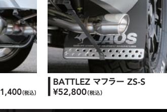
BATTLEZ マフラー ZS-2 / ZS-2 TC 【ZS-2】 ¥70,400(税込) 【ZS-2 チタンカラーテール】 ¥81,400(税込)