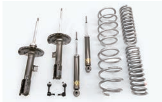
BATTLEZ リフトアップセット VFS 【ディーゼル 19+用】¥144,100(税込)

サスペンションコイルの「ヘタリ」を同製品が販売している限り交換保証するというのがBATTLEZ Ti-Wの「ヘタリ保証」。保証内容の詳細については、JAOS オフィシャルサイトをご参照ください。さらに「ハーモフレック®」を内蔵したプレミアムダンパー BATTLEZ ダンパー VF シリーズも好評発売中です。