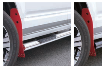
JAOS サイドステップ ポリッシュ ¥118,800(税込)