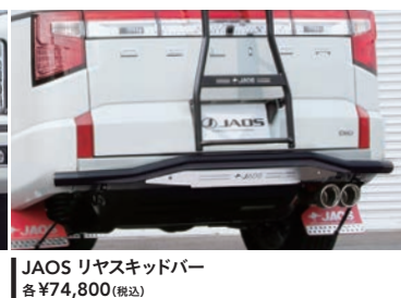
JAOS リヤスキッドバー 各 ¥74,800(税込)