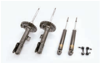
BATTLEZ ダンパー VFS 【ディーゼル 19+用】¥88,000(税込)

■年式：19.02- ■取付時間：3.0H ■取付方法：純正フロントアッパーマウント流用 ■リフトアップ：フロント 10～30mm、リヤ 20～25mm