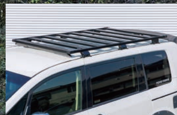
JAOS フラットラック(ロータイプ) [1250×1920] ¥176,000(税込)