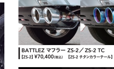
JAOS サイドステップ ブラック 右側 (運転席側) ¥48,400(税込)