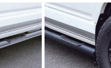
JAOS サイドステップ ブラック ¥96,800(税込)