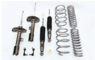
BATTLEZ リフトアップセット VFAS 【ディーゼル 19+用】¥160,600(税込)

■年式：19.02- ■取付時間：2.5H ■取付方法：純正交換 ■リフトアップ：フロント 約20mm、リヤ 20～25mm