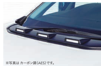
※写真は カーボン調 (AES) です。 JAOS ボンネットディフレクター 【カーボン調、マットブラック】 ¥66,000(税込) 【未塗装品】 ¥57,200(税込)