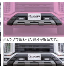
※ピンクで囲われた部分が製品です。 ※写真は マットブラックです。