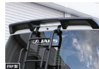
JAOS ルーフスポイラー type-B 【マットブラック】 ¥72,600(税込) 【未塗装品】 ¥52,800(税込)