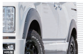
JAOS フェンダーガーニッシュ type-X 【マットブラック】 ¥85,800(税込) 【未塗装品】 ¥63,800(税込)