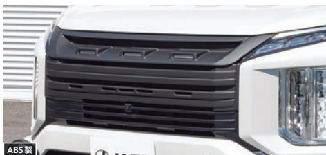
JAOS フロントグリル 【マットブラック】 ¥88,000(税込) 【未塗装品】 ¥70,400(税込)