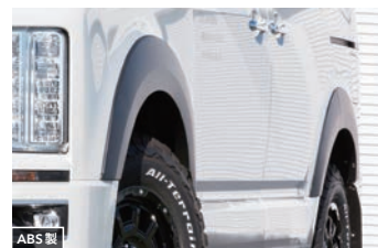
JAOS フェンダーガーニッシュ type-S 【マットブラック】 ¥81,400(税込) 【未塗装品】 ¥59,400(税込)