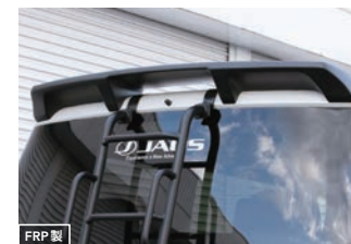
JAOS ループスポイラー type-B [マットブラック] ¥77,000(税込) [未塗装品] ¥57,200(税込)