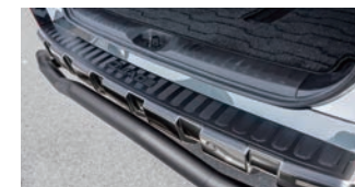
JAOS バックドアスカフプロテクター ¥9,900(税込)