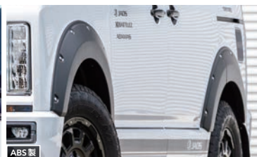
[カーボン調、マットブラック] ¥66,000(税込) [未塗装品] ¥57,200(税込)