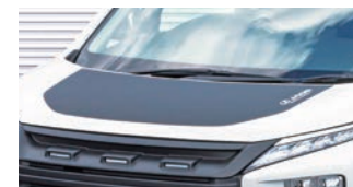
JAOS ボンネットプロテクター ¥30,800(税込)