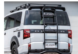
JAOS リヤラダー AL ¥85,800(税込)