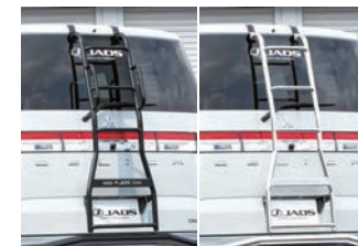
JAOS リヤラダーII (ポリッシュ or ブラック) [ハンドル付] ¥68,200(税込) [ハンドル無] ¥61,600(税込)