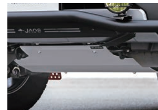
JAOS スキッドプレート type-R ¥41,800(税込)