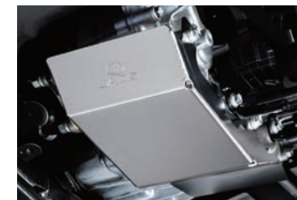
JAOS トランスファーガード ¥19,800(税込)

※1台分の取り付けには「JAOS マッドガードIII 汎用Lサイズ」が2セット必要。