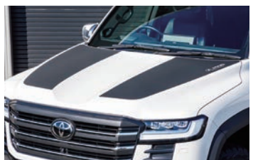
JAOS ボンネットプロテクター ¥39,600(税込)