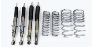
ZX, GR SPORT, VX, AX 用

BATTLEZ ローダウンセット VFCA 【エンジン別設定】¥209,000(税込)