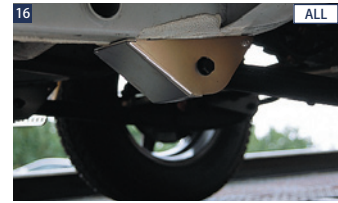
16 ALL JAOSアームプロテクター(フロント) ■ステンレス/電解研磨+ショットプラスト ■左右セット ■ボルトオン ■JAOSロゴ刻印