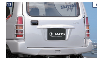
13 ALL JAOSリヤハッチパネル ■FRP/未塗装 ■ボルトオン ■純正ナンバー灯流用 ■要リヤワイパー及びウォッシュノズル取り外し