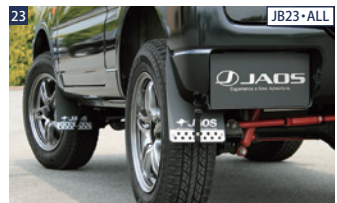
23 JB23・ALL JAOSマッドガードIIIジムニー専用タイプ ■EVAフラップ(XSサイズ/レッド・ブラック)×2、ハンガーベルトキット×2、専用取付プラケット ■ボルトオン ■JAOSリヤクロスカウル同時装着不可 ■フロントまたはリヤの左右セット