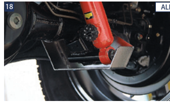
18 ALL JAOSダンパープロテクター(リヤ) ■ステンレス/電解研磨+ショットプラスト ■左右セット ■ボルトオン