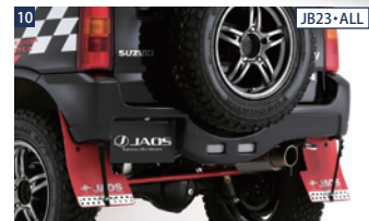
10 JB23・ALL JAOSリヤスポーツカウル ■ウレタン/未塗装 ■純正バックアップランプ、ナンバー灯流用 ■185/85-16装着可

◎写真のデモカー(JB43)はBATTLEZサスペンションセットVFAICより約40mmリフトアップされています。