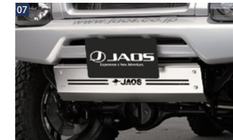
07 JAOSスキッドプレートCC ■ステンレス/電解研磨+ショットプラスト ■フロントクロスカウル付車専用 ■要加工