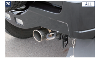
20 ALL JAOS牽引フック(リヤ) ■ステンレス(9.0mm厚)/電解研磨+ショットプラスト ■強化ボルトセット付 ■ボルトオン(純正バンパー取付不可) ■競技用