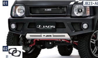
01 JB23・ALL JAOSフロントスポーツカウル(JB23) ■ウレタン/未塗装 ■純正フォグランプ流用(フォグランププラケット別売) ■フォグランププラケットは年式によって形状異なる ■スキッドプレート別売