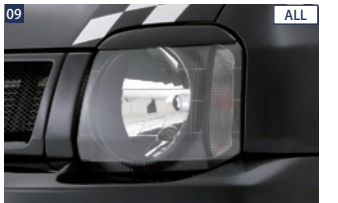
09 ALL JAOSヘッドライトガーニッシュ ■FRP/未塗装 ■両面テープ