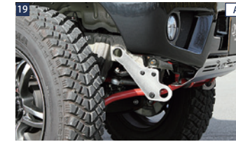
19 ALL JAOS牽引フック(フロント・右) ■ステンレス(9.0mm厚)/電解研磨+ショットプラスト ■強化ボルトセット付 ■ボルトオン(純正バンパー取付不可) ■左右別売(フロント左はJB23専用)