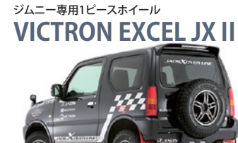
ジムニー専用1ピースホイール VICTRON EXCEL JX II ■サイズ: 16inch/5.5J+22 ■鍛造1ピース ■カラー: ディープガンメタ ■規格: JWJL/JWJL-T(ジムニー専用)