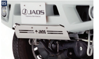
05 JAOSスキッドプレートSC(JB43/33) ■ステンレス/電解研磨+ショットプラスト ■JB33/43フロントスポーツカウル付車専用 ■フレームのカット加工が必要