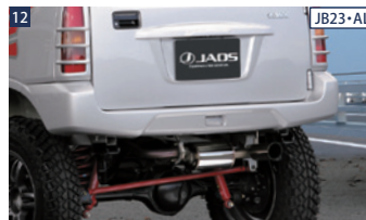
12 JB23・ALL JAOSリヤクロスカウル ■ウレタン/未塗装 ■ボルトオン ■純正バックアップランプ流用 ■要ナンバー移動