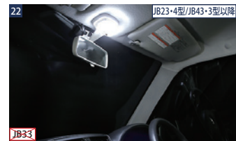
22 JB33 JAOS LEDルームランプ ■フロント用 ■LED総数12個 ■純正交換