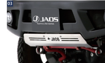
03 JAOSスキッドプレートSC(JB23) ■ステンレス/電解研磨+ショットプラスト ■JB23フロントスポーツカウル付車専用