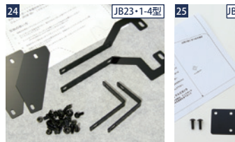
24 JB23・1-4型 JAOSマッドガード車種別取付キット ■JAOSマッドガードIII汎用タイプSの装着を容易にする車種別取付キット(JB23の場合は左記のジムニー専用タイプマッドガードをご購入いただいた場合は必要なし) ■1台分セット ■1台分の装着には別途JAOSマッドガードIII汎用タイプS(右記)が2セット必要