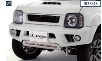
04 JB33/43 JAOS フロントスポーツカウル(JB43/33) ■FRP/未塗装 ■純正フォグランプ流用 ■年式によりフレームのカット加工が必要 ■スキッドプレート別売