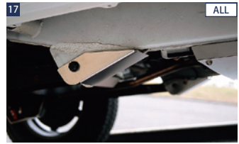
17 ALL JAOSアームプロテクター(リヤ) ■ステンレス/電解研磨+ショットプラスト ■左右セット ■ボルトオン ■JAOSロゴ刻印