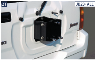
21 JB23・ALL JAOSスペアタイヤプラケット ■ステンレス/カチオン電着塗装 ■ラグカット付属 ■インセット調整機構付 ■純正交換 ■道路運送車両法不適合(全長超過)