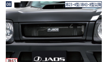
08 JB23-4型/JB43-8型以降 JAOSフロントグリル ■FRP/未塗装+メッシュ ■ボルトオン+両面テープ ■エンブレム販売終了