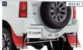
11 JB33/43 JAOSリヤスポーツカウル ■FRP/未塗装 ■JB23W用テールレンズ左右/ワイヤーハネス/バックランプ×2が別途必要 ■配線加工が必要