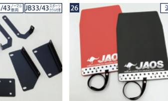
25 JB33/43 JB33/43 JAOSマッドガードIII汎用タイプS ■レッドとブラックの2タイプ ■EVA製フラップ×2、アルミプレート×2、ナイロン製ベルト×2 ■1台分・前後装着には2セット必要