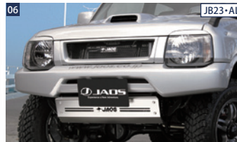
06 JB23・ALL JAOSフロントクロスカウル ■ウレタン/未塗装 ■スキッドプレート別売