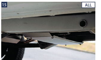
15 ALL JAOSトランスファーガード ■ステンレス/電解研磨+ショットプラスト ■ボルトオン ■BATTLEZ×EX typeZ5前期モデル(フロントパイプ付)同時装着不可 ■フレームに穴が開いていない場合、加工が必要